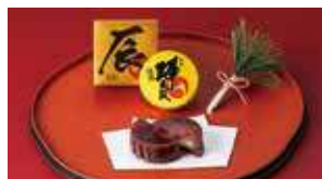
年末年始限定「干支陣太鼓」