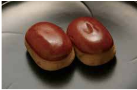
栗饅頭 / 湖月堂