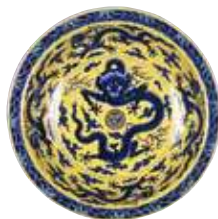
「青花黄彩雲龍文盤」 〔大清乾隆年製銘（清時代）〕

https://setouchifinder.com/ja/detail/25285/