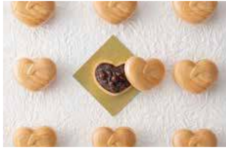
あいさつ最中 / 清月堂本店