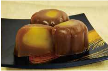
栗むし羊羹 / 赤坂青野