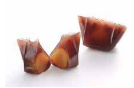
四季の心「栗小倉羹」 / 御菓子司 鶴屋八幡