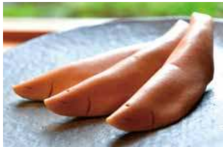
登り鮎 / 玉井屋本舗