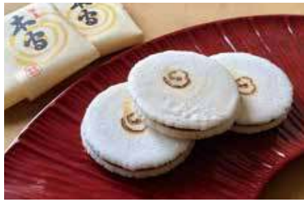
木守 / 三友堂