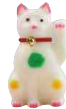
招き猫 中は空洞。型抜きしてから彩色する。

金花糖(＊)をご存じでしょうか。砂糖と水を煮詰め、型に流して作る菓子で、動物や人形をかたどった可愛らしいものが、雑誌やテレビ番組で紹介されることがあります。