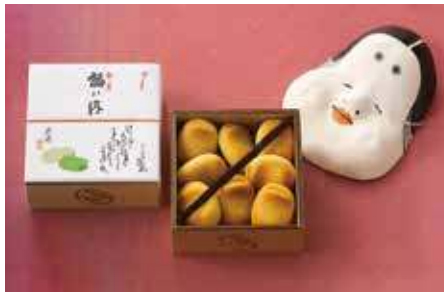
福八内 / 鶴屋吉信