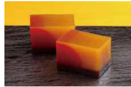
日の出 / 風流堂