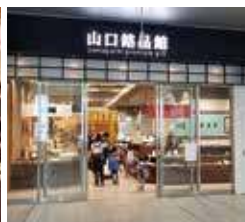
新幹線ホームの改札前にある「山口銘品館」内に誕生。