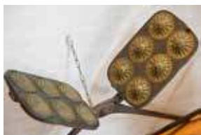
▲平治煎餅の焼型(原型)。 ▶代表銘菓の「平治煎餅<小笠>」(写真左)。「ショコラ」(中)、「ホワイトショコラ」(右)などバリエーションが広がっている。

「平治煎餅は、平らに焼いた煎餅を曲げて立体にしているのではなく、表裏2枚の型に生地を流して合わせ、何度も