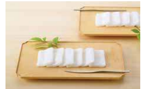
羽二重餅 / 羽二重餅總本舗 松岡軒