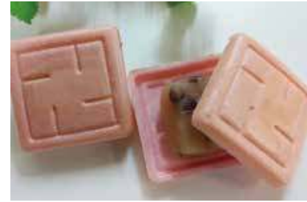
祀最中・桜 / 開雲堂