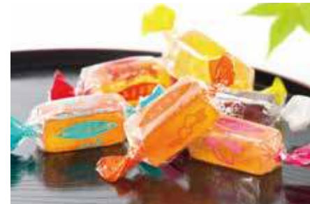
みすゞ鮎 / みすゞ鮎本舗 飯島商店